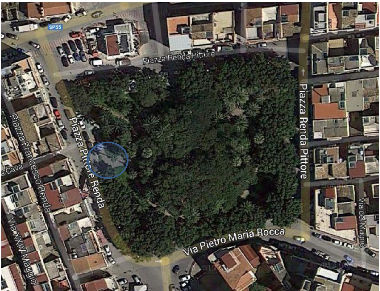
5) Piazza Pittore Renda