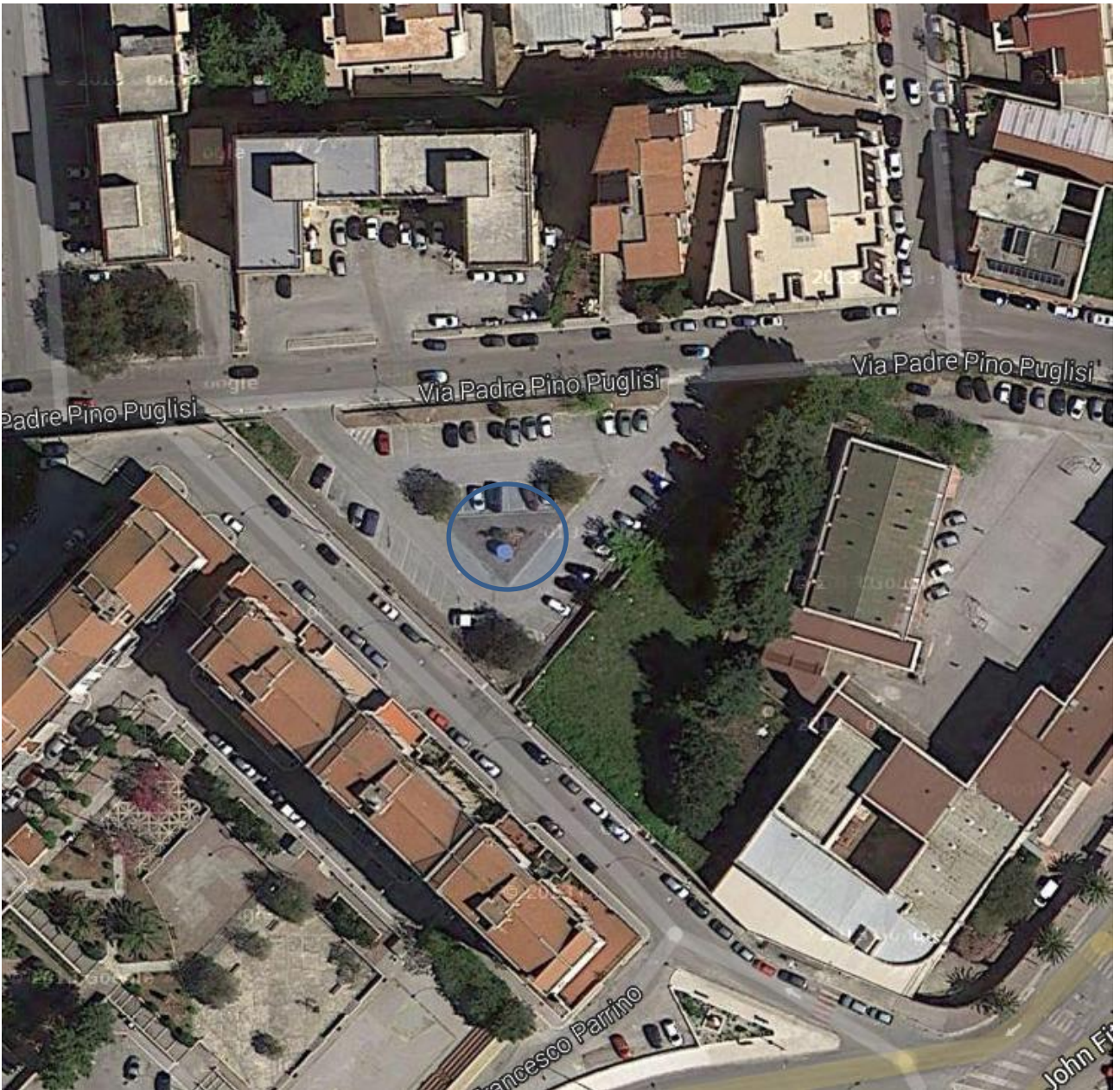
10) Via Padre Pino Puglisi