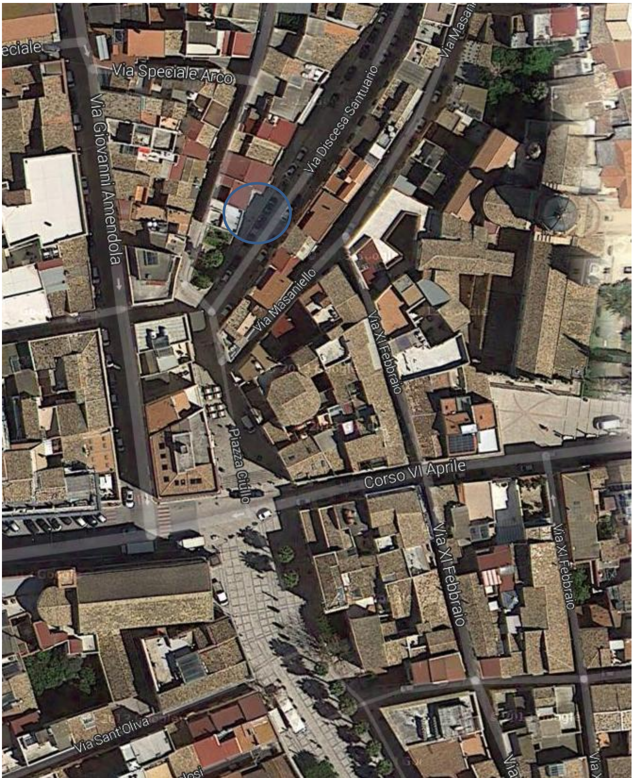
13) Via Discesa Santuario