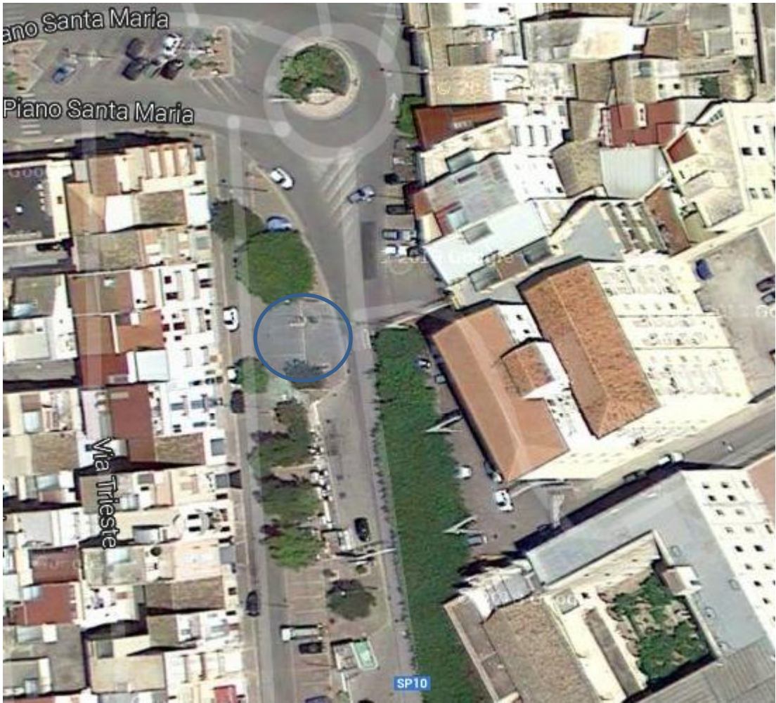
2) Piano Santa Maria