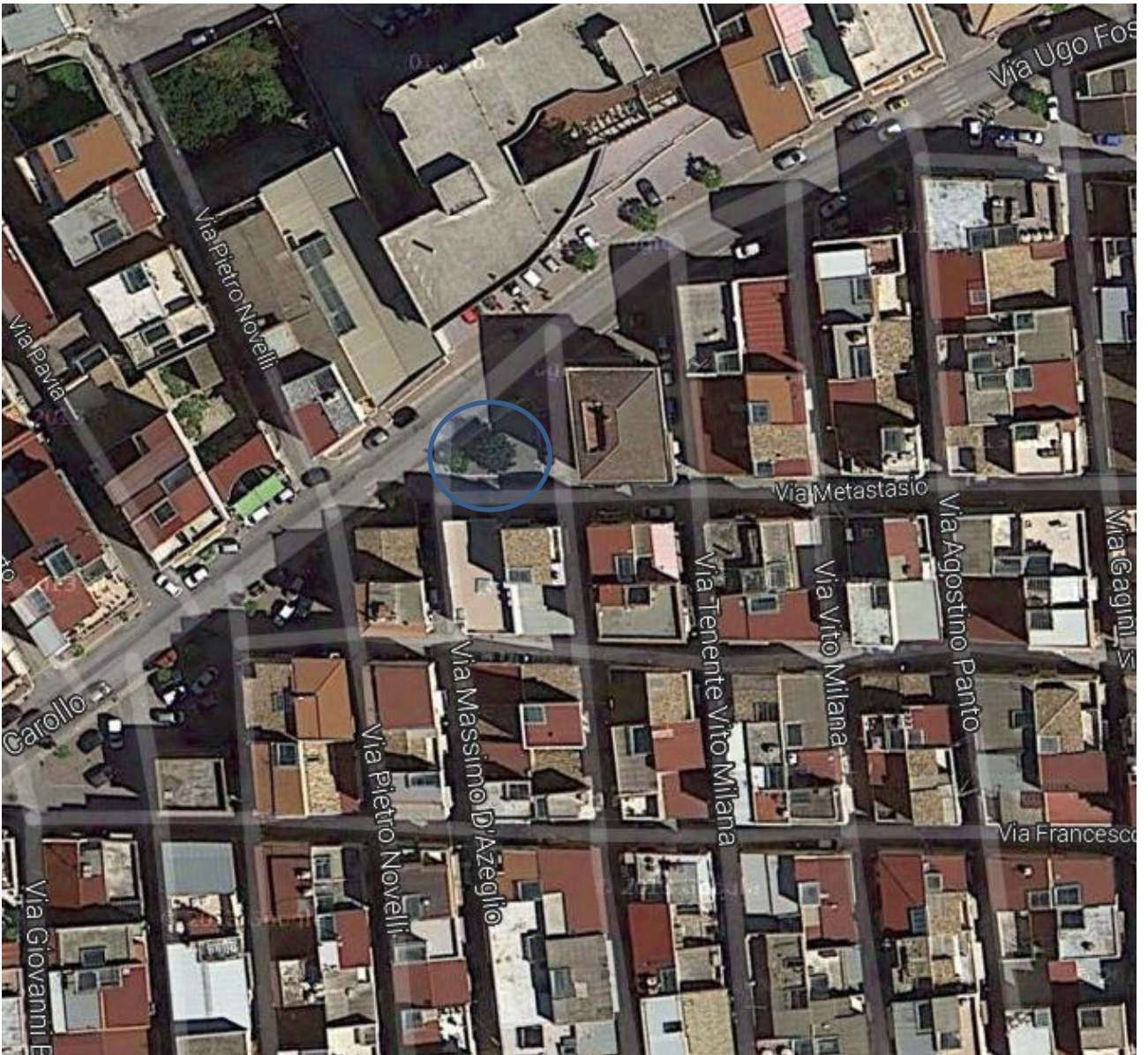
9) Via Ugo Foscolo