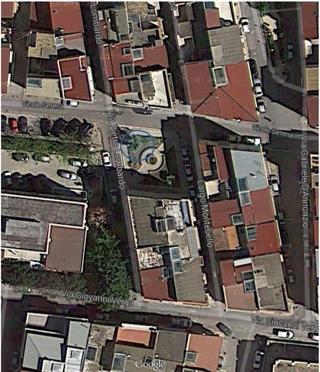
14) Via Pietro Lombardo