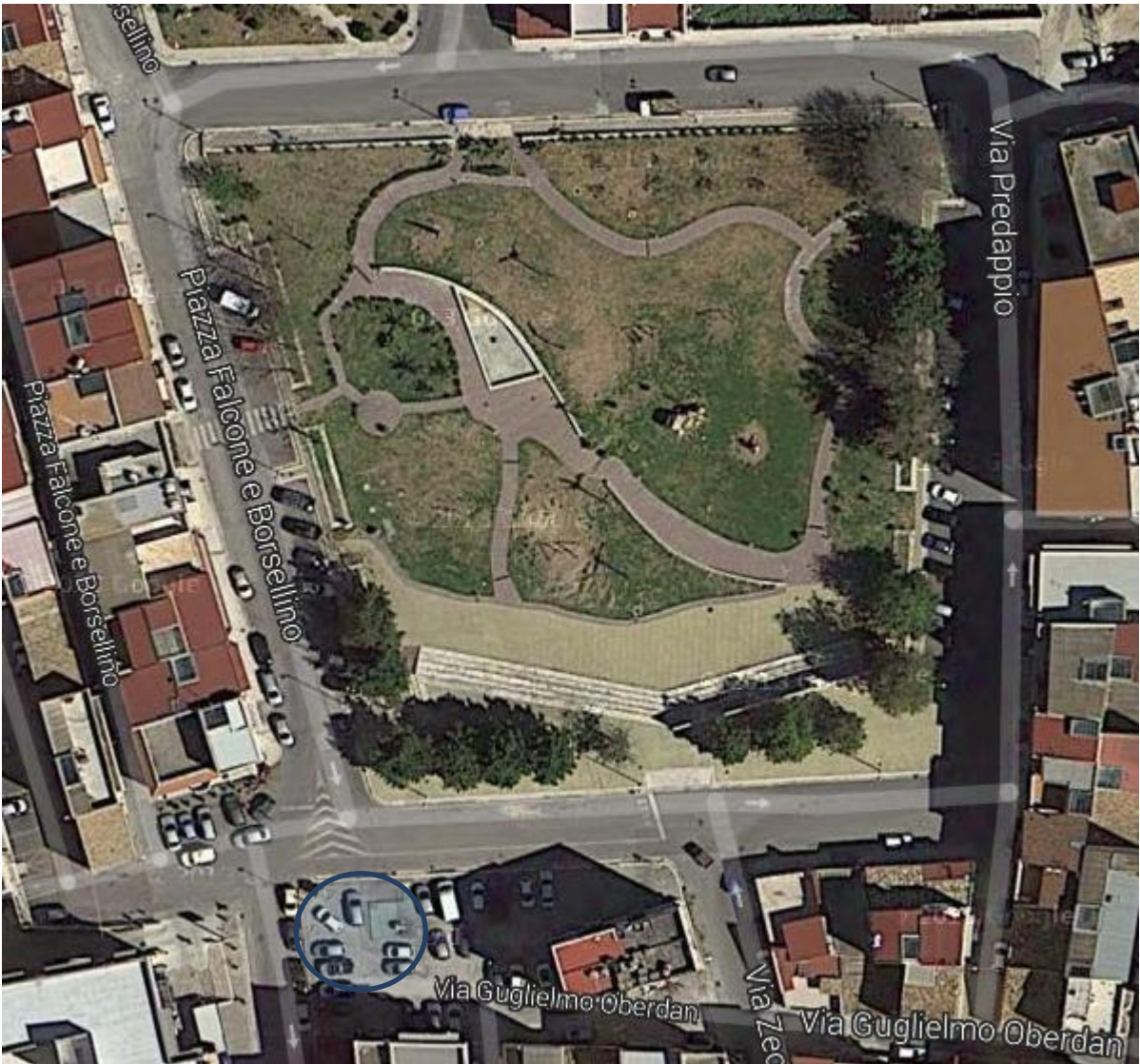
1) Piazza Falcone e Borsellino