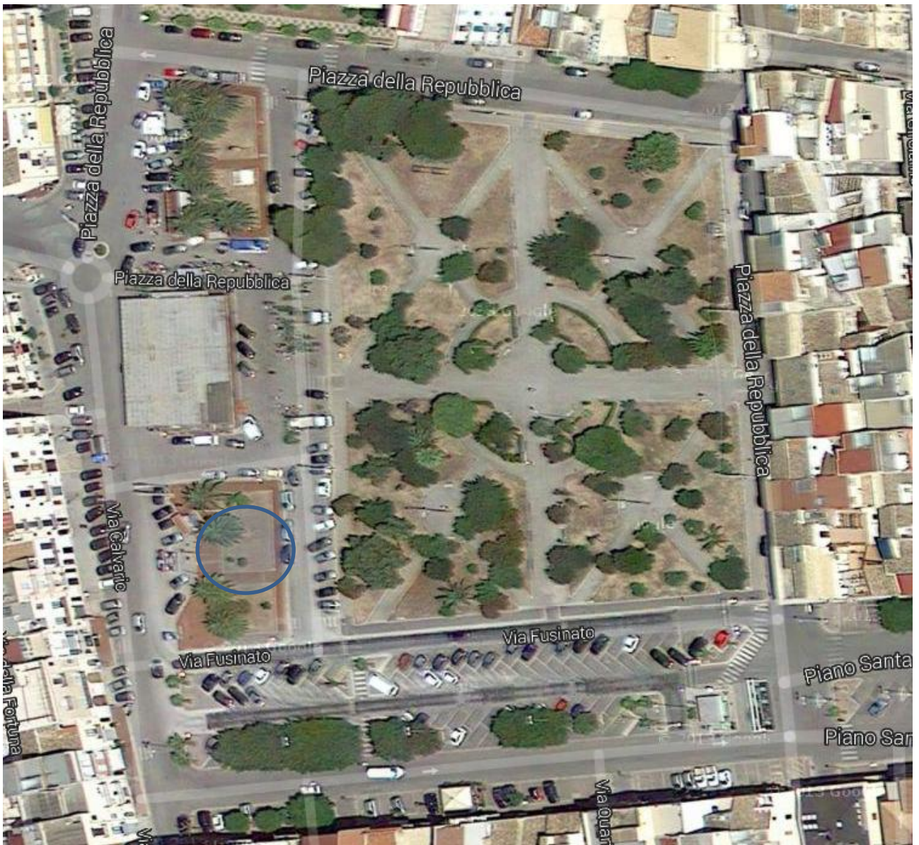
4) Piazza della Repubblica