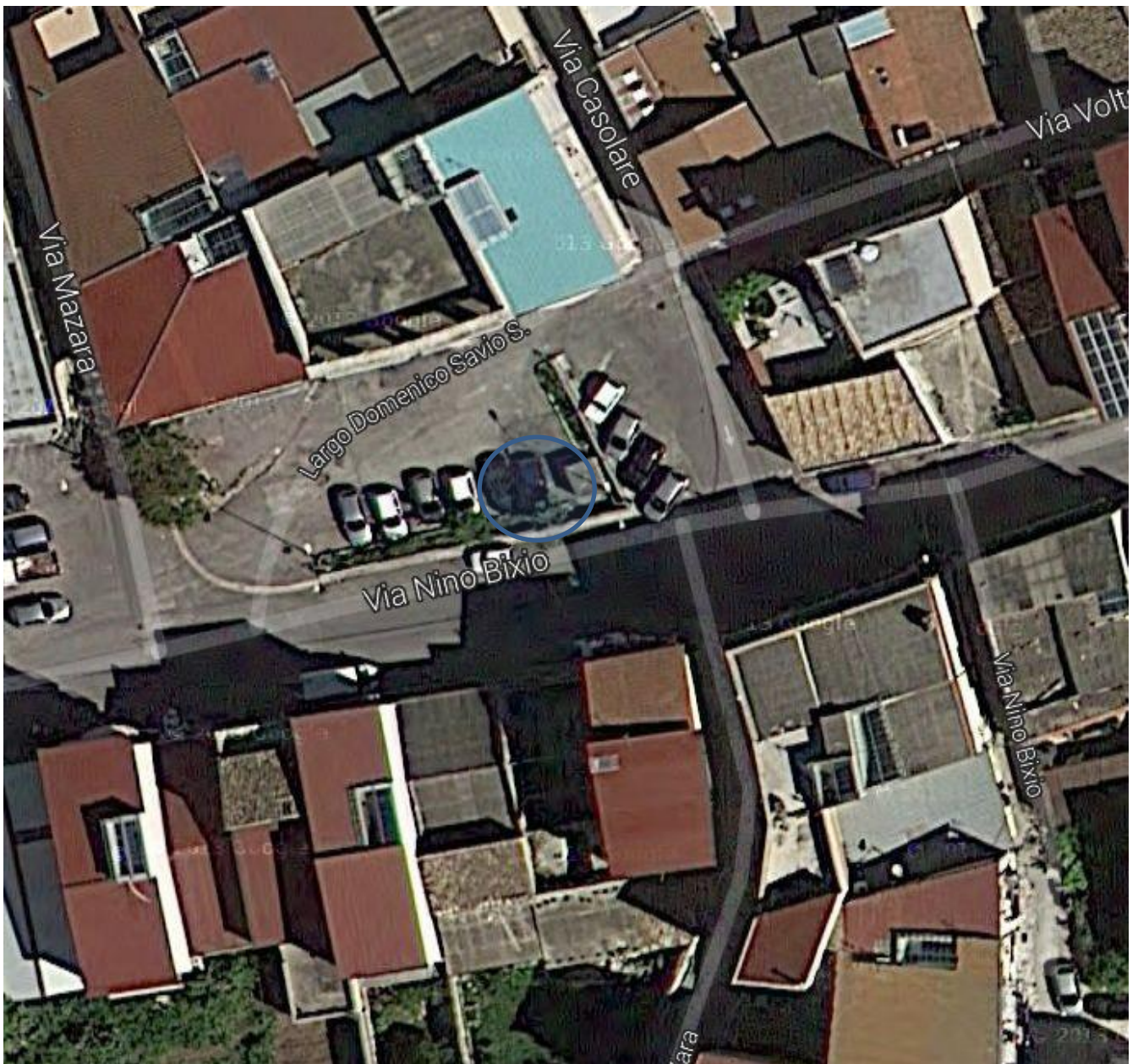
6) Via Nino Bixio – Largo San Domenico Savio