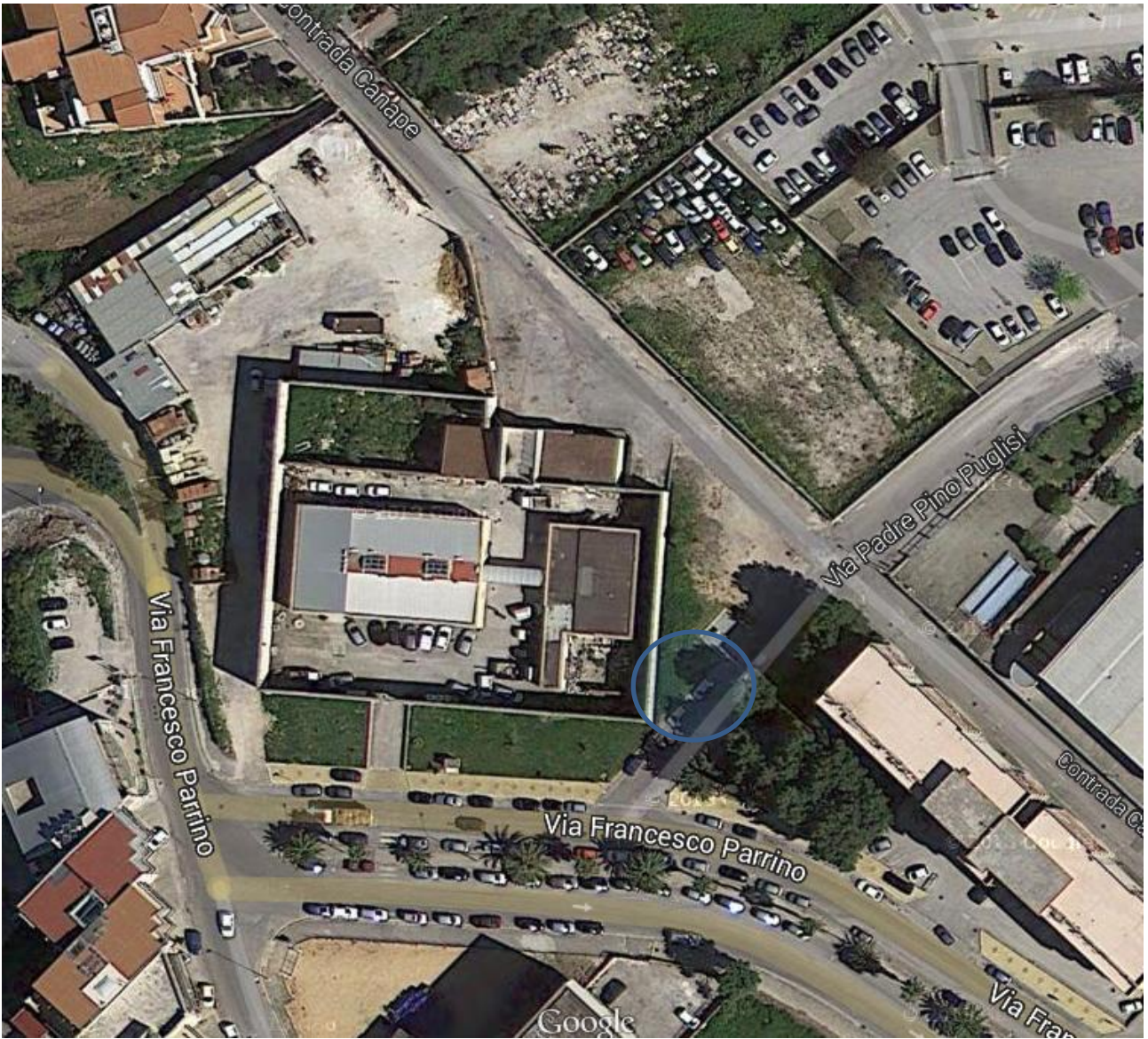
12) Via Sen. Parrino