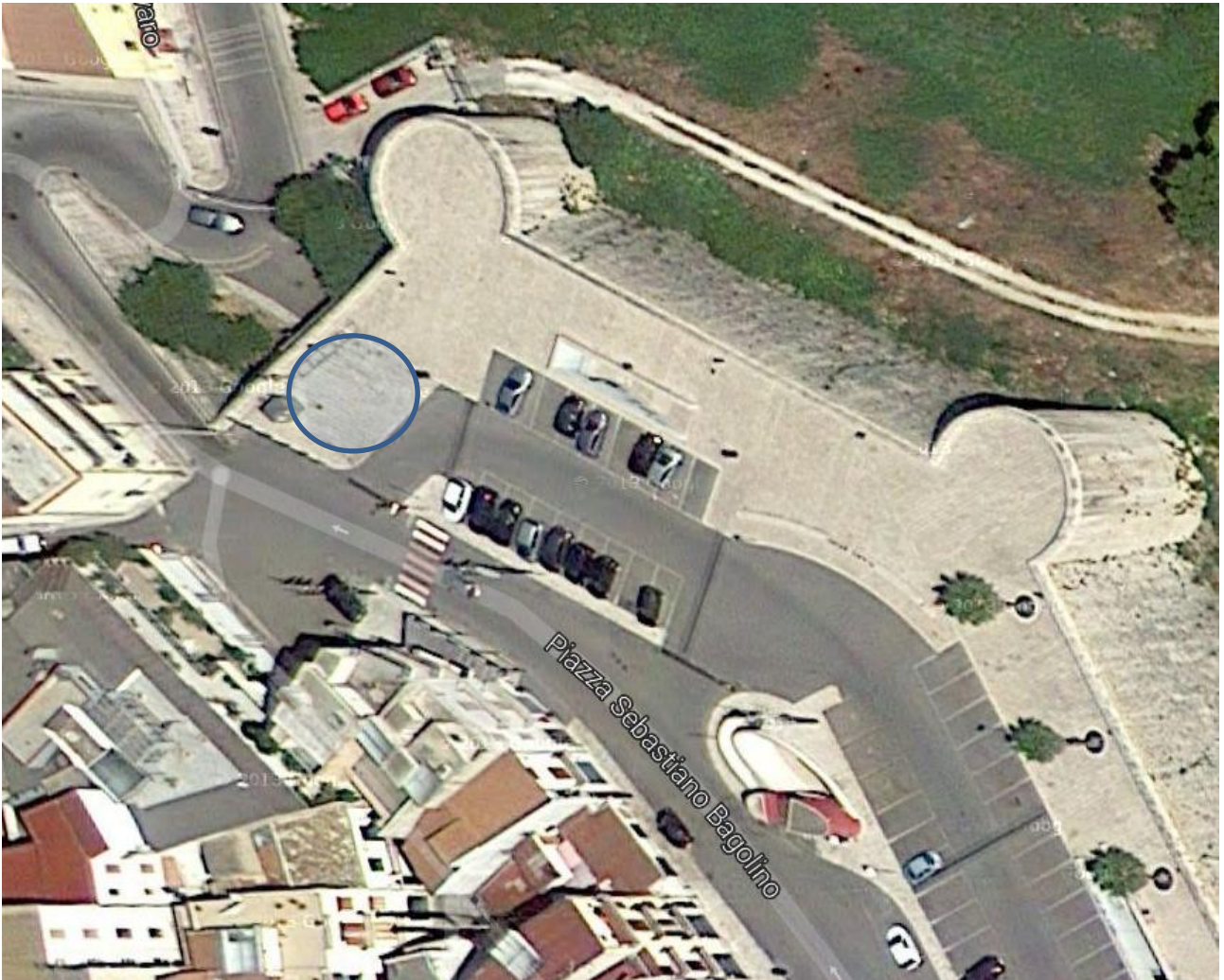
3) Piazza Bagolino