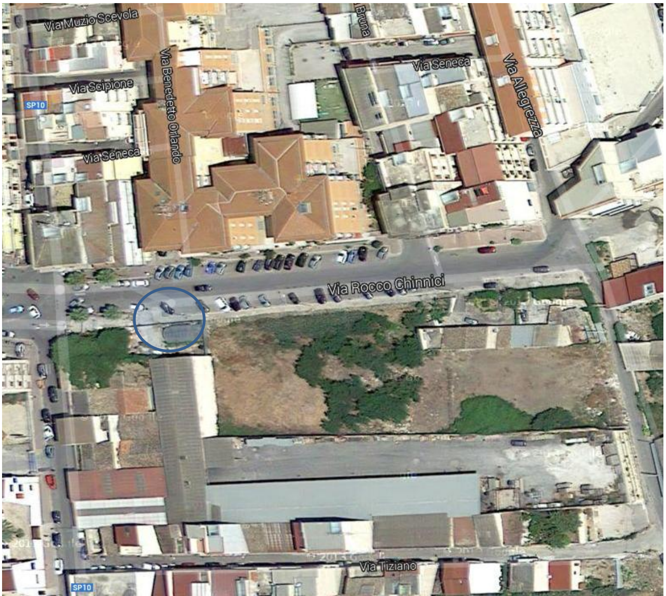
11) Via Rocco Chinnici